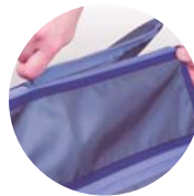
Extensor tallas XXL